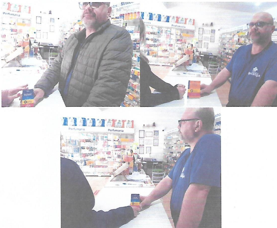
Figura 3. Entregas realizadas a pacientes, ou a parentes que fazem a retirada da medicação.