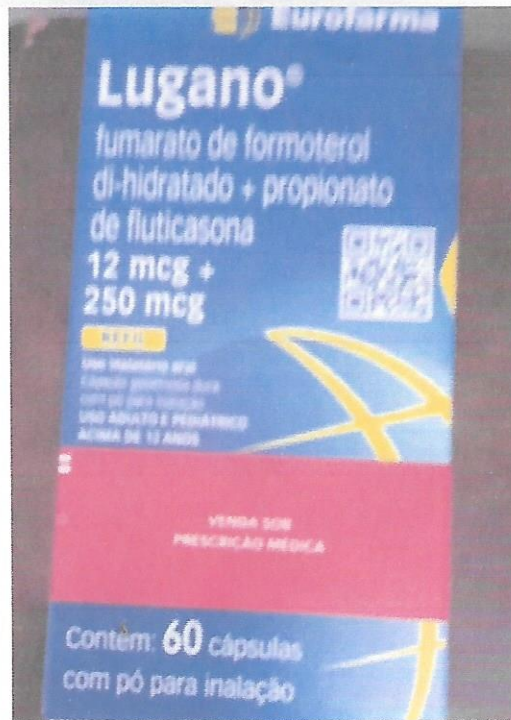
Figura 2. Imagem de um dos itens de medicamentos.

CERTIDÃO DE UTILIDADE ESTADUAL Nº 002260